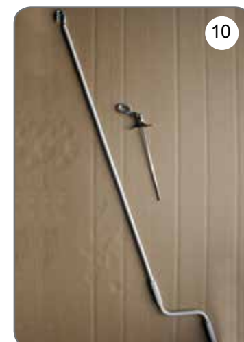
Korba, przegub Cardana 45° lub 90° z uchem [10].