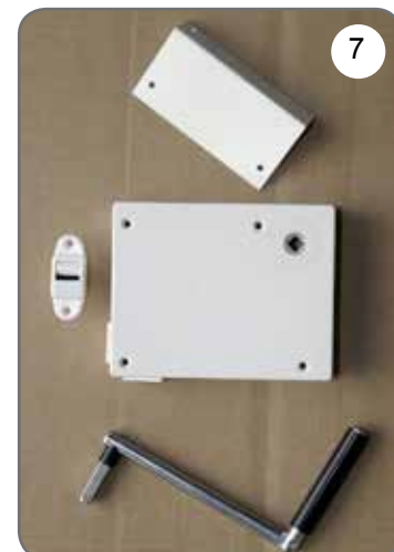
Kaseta z przekładnią na taśmę (pasek), płytka do mocowania kasety, prowadnica taśmy (paska), korba [7].